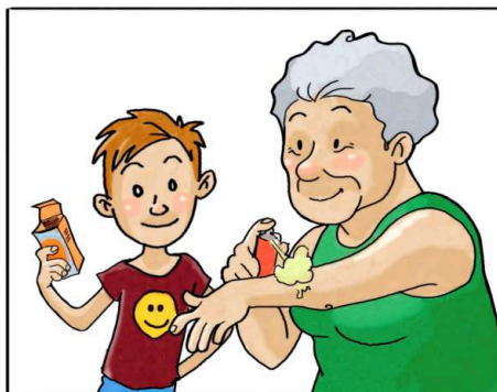
USA I REPELLENTI CUTANEI SEGUENDO LE INDICAZIONI RIPORTATE SULLE CONFEZIONI.