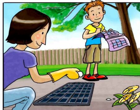
RICORDATI DI TRATTARE I TOMBINI CON PASTIGLIE DI INSETTICIDA, NEL PERIODO DA APRILE A SETTEMBRE. (*)