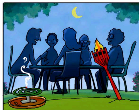
QUANDO SOGGIORNI ALL'APERTO, PROTEGGITI CON REPELLENTI AMBIENTALI. (*)

(*) Leggi attentamente le istruzioni riportate sulle confezioni.