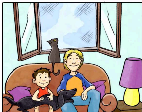
IN CASA USA LE ZANZARIERE ANZICHÉ ZAMPIRONI E FORNELLETTI.