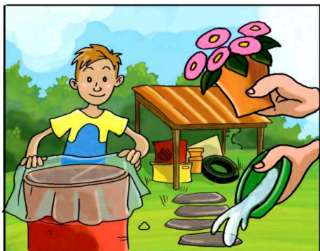
METTI AL RIPARO DALLA PIOGGIA TUTTO CIÒ CHE PUÒ RACCOLGERE ACQUA.